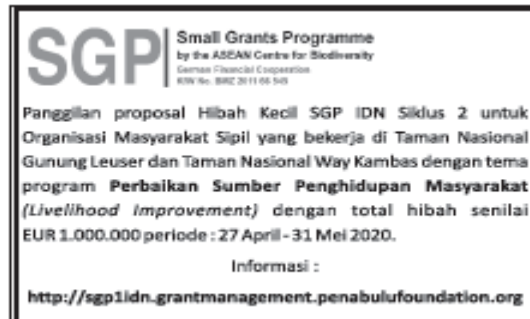
Gambar 3. PSA Visibility di Harian Media Indonesia

Public Service Advertising (PSA) di media massa lokal dan nasional terlampir pada Lampiran 2 .