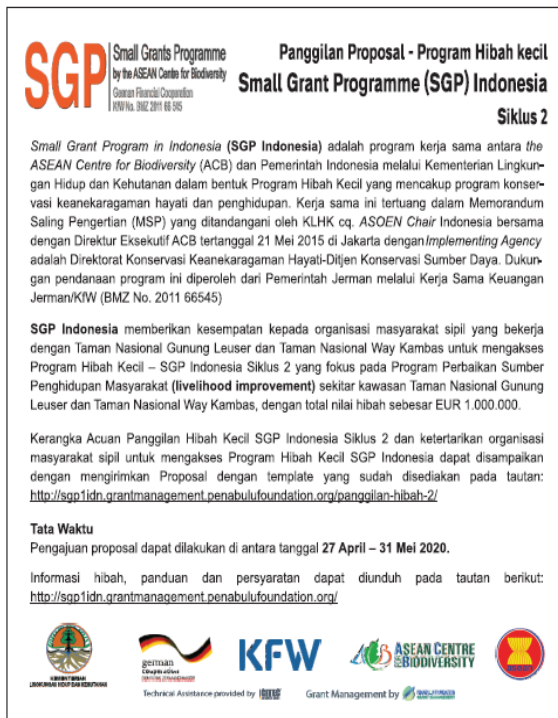
Gambar 1. PSA Visibility di Harian Lampung Pos